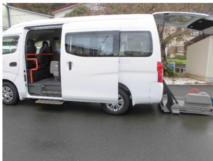
(日産キャラバン9人+車いす1人乗り)