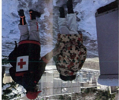
被災者に寄り添う浜松赤十字病院職員