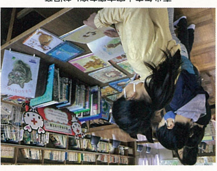
青少年赤十字文庫を楽しむ児童

未来を担う子どもたちに、防災教育や奉仕活動などを通じ、学びや体験の機会を提供しています。令和5年度からは3か年計画で、「やさしさと思いやりの心を育むような書籍を集め、「青少年赤十字文庫」としてJRC加盟校に整備する事業を進めています。令和5年度は、加盟小学校及び特別支援学校164校に約8,500冊を整備しました。