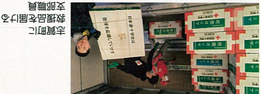
志賀町に救援品を届ける支部職員