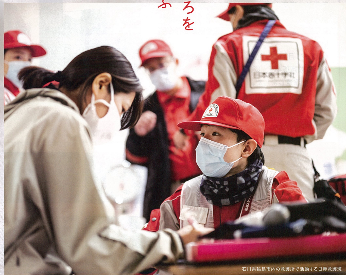
石川県輪島市内の救護所で活動する日赤救護班