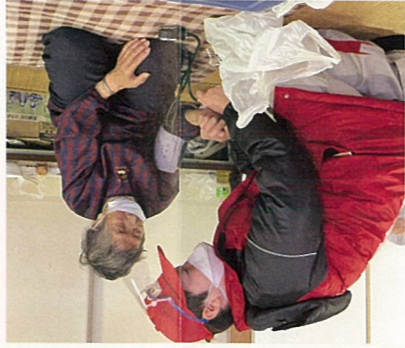
避難所での診療の様子