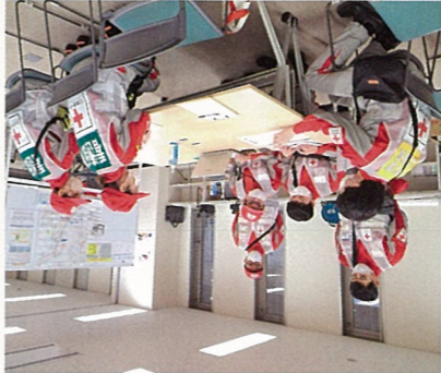
現地で打ち合わせする静岡赤十字病院救護班

令和6年1月1日に発生した能登半島地震では、被災地に救護班4班、災害医療コアチーム1班を派遣しました。（1月末時点）