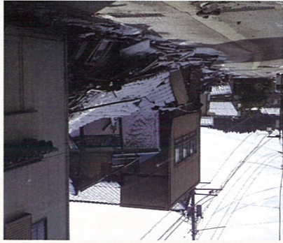
能登半島地震の被害状況