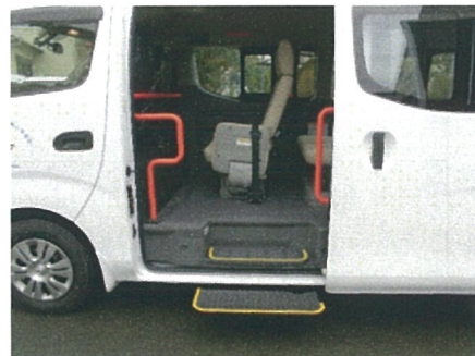
(手摺り・ステップ完備)