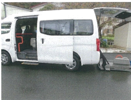
(日産キャラバン 9人+車いす1人乗り)