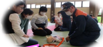
人形を使って心肺蘇生