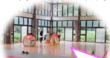
おもいっきりあそんだよ！

いつどこでどうなるのかわかりませんが、生活に少しでも役立てていただきたいと思います。これからの時季は、熱中症・水難事故など十分気をつけていきましょう。