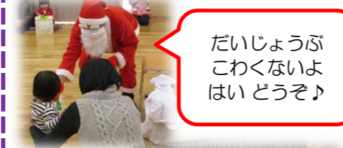
だいじょうぶこわくないよはいどうぞ♪