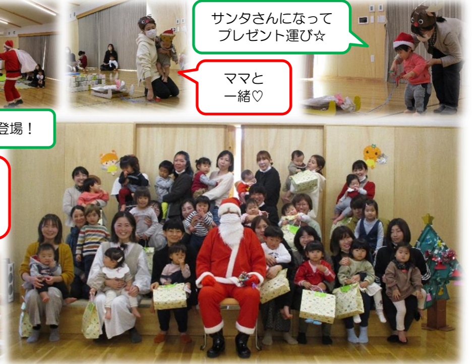
☆最後にサンタさんとパチリ! みんなで飾りつけをしたクリスマスツリーもいっしょ☆