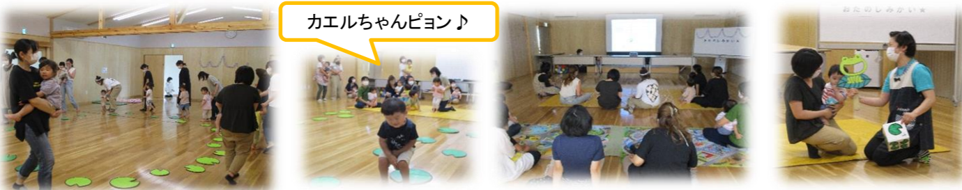
カエルちゃんピョン♪

センターに遊びに来てくれたお友達の中には6月うまれがいませんでした。“おたのしみかい”に名前をかえ、大きな画面で絵本を見たり、カエルさんになりきってゲームをしたり、カスタネットを鳴らしたりして楽しみました。最後はハスの葉取りゲームをしてからだを動かして遊びました。