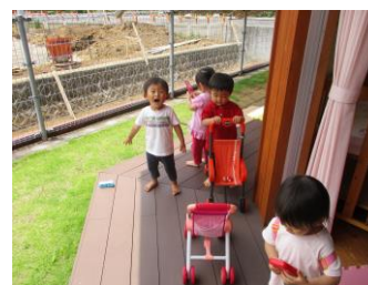
テラスでも元気いっぱい!