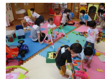
好きな遊びを楽しんでいます~す!