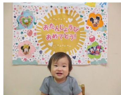
☆6月生まれのお友達☆