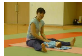
村瀬先生ご指導ありがとうございました。