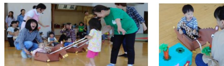
No.4 『おうまでパッカパカ』お馬さんに人参を食べさせてあげたね。