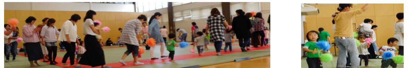
No.1 『みんなで行進』ポンポンを持って歩いたね！

支援センターの運動会に多数参加していただき、ありがとうございました。お家の人やお友だちの笑顔がたくさん見ることが出来ました♡