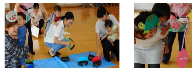
No.5 『おやおやこ・こ・こ』親子で動物になって自分の写真を見つけたね！