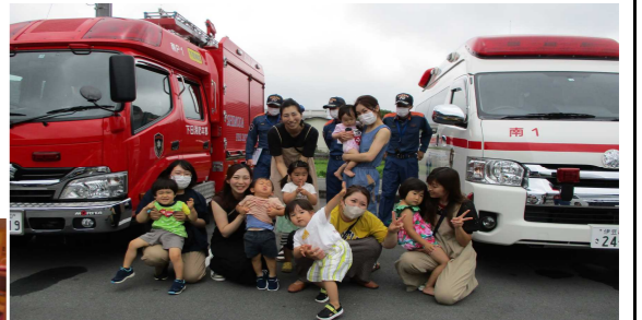
講座のあとは緊急車両の見学ができ、大人気の消防車・救急車でした。