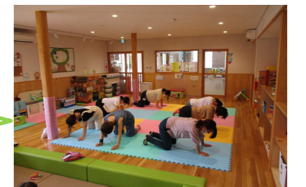
助産師さんの指導で行った骨盤体操の様子です。