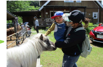
ママのスマホで写真を撮って見たよ☆