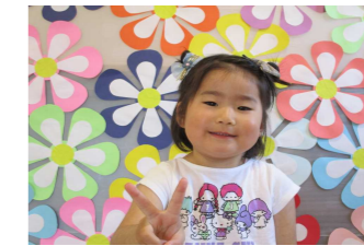
5がつうまれの おともだち おたんじょうび おめでとう♪

3名のおともだちをお祝いし、はらぺこあおむしのペープサートを見たり、親子製作でデカルコマニーをしたりしました。