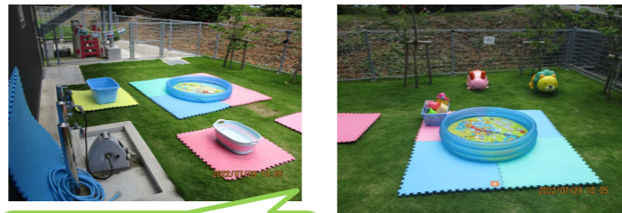
プールやタライをいくつか出します♪