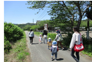
うっすら汗ばむくらいの良い天候でした☀

♪♪ 乗馬クラブまでお散歩したよ ♪♪ 5/16(火)近くの乗馬クラブまで歩きました。大人にとっては“ちょっとそこまで”の道のりも、小さなお友達にとっては大冒険。すごいね！がんばって歩いたね！たくさん発見したね！