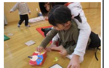
おだいきさまとおひなさま すてきだね✿