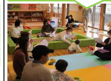
栄養士による講話の様子

発育測定の後、相談内容に応じて保健師・助産師や栄養士と話をしています。今月は栄養士より「子どもの食事とおやつ」についての講話がありました。今年度は10:00~測定でしたが、4月より9:30~測定となります。