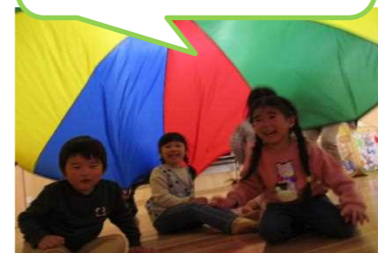
桜がきれいだね~ おひさまあったかいね~