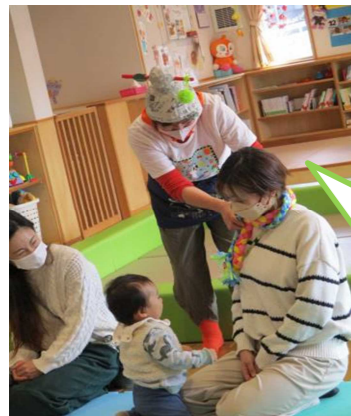
できた できた! ママの マフラー☆

「いとまき」の手遊びでマフラーや帽子を作り、「おおきなだいこん」のパネルシアターを見た後にだいこんの収穫をしました!(紙をビリビリ破いて収穫したよ☆)