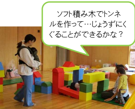
ソフト積み木でトンネルを作って…じょうずにくぐることができるかな?