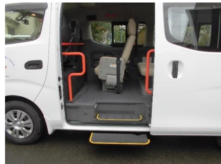
(手摺り・ステップ完備)