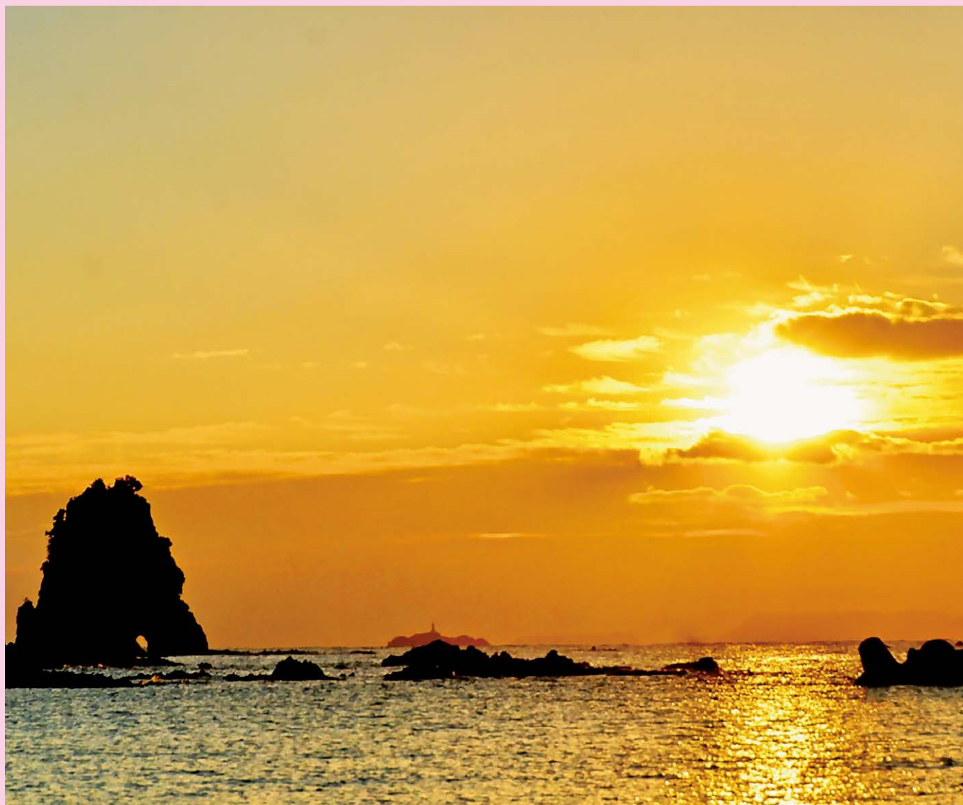
2026年初日の出～大瀬から撮影

発行／南伊豆町議会 編集／議会広報編集委員会 〒415-0392 静岡県賀茂郡南伊豆町下賀茂315-1 TEL0558(62)6240 E-mail:gikajj@town.minamiizu.shizuoka.jp