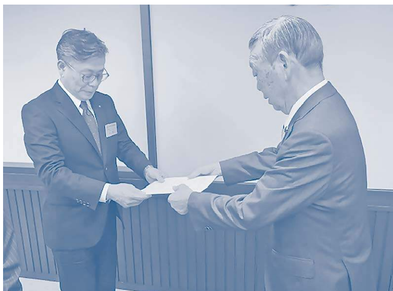
池上教育長（左）、意見書を手渡す比野下議長（右）