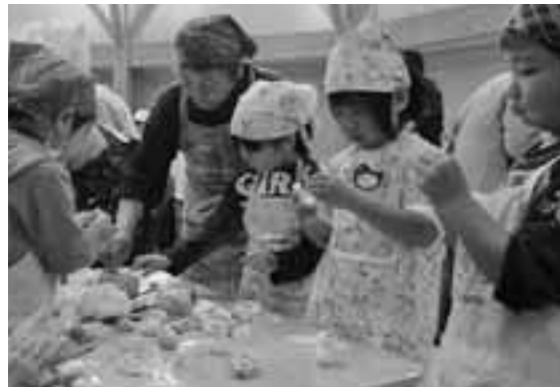
お年寄りと一緒に14日だんご作りを体験する園児たち

1月11日、南伊豆認定こども園で5歳児40人が14日だんご作りを体験しました。園児たちは笑顔会や老人会会員から指導を受けながら、思い思いの形のだんごを作りました。