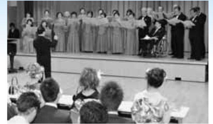
お祝いの歌を披露する南伊豆グリーンコーラス