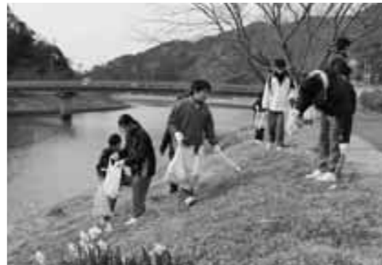
青野川周辺でごみ拾いをする生徒たち

1月17日、みなみの桜と菜の花まつりの開催を前に、南伊豆東中学校と南伊豆東小学校、南伊豆中学校と南中小学校が連携し、地域貢献活動として青野川周辺の清掃を行いました。