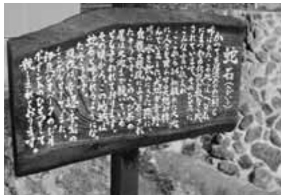
新しく作られた蛇石（へびいし）の案内看板

蛇石地内にある蛇石（へびいし）の案内看板が、このほど、地域おこし協力隊によって新しくなりました。已年にちなみ、蛇石（へびいし）とあわせて、ぜひご覧ください。