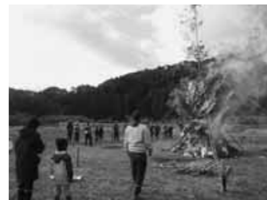
勢いよく燃え、炎が空高く舞い上がりました。

下小野のヤギ牧場前の広場で、年配の方々も初めの行事の復活を懐かしいと喜び、子どもたちは初めてのイベントを楽しんでいる様子でした。私にとっても初めての体験で、とても貴重な場に立ち合わせていただきました。