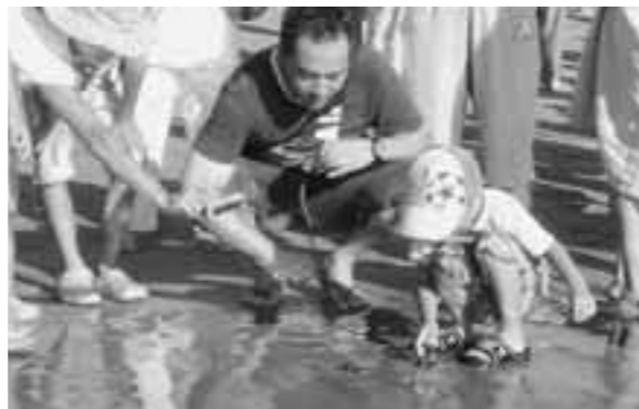
海へ向かうアカウミガメを見守る親子

8月25日、弓ヶ浜海岸でアカウミガメの赤ちゃん49匹の放流が行われました。今年は6月6日に産卵が確認されてから8月3日までに、過去最多の10匹が産卵し、産卵個数は合計1,203個です。