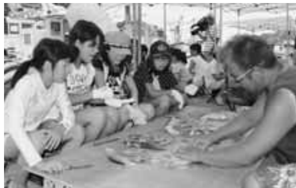
漁協青年部からイカの開き方を教わる児童たち

8月6日、妻良漁港で水産教室が行われ、町内小学校の児童74人が参加しました。主催の伊豆漁協南伊豆支所青年部の指導を受けながら、スルメイカを開き、ひもの加工などを体験しました。