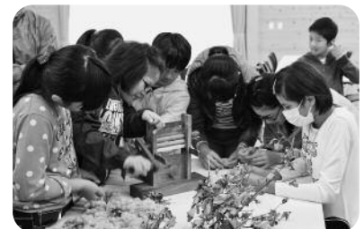
オーガニックコットンプロジェクトの様子です