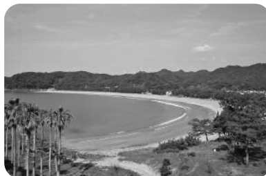
町の景観形成ガイドプランを策定するために活用しました