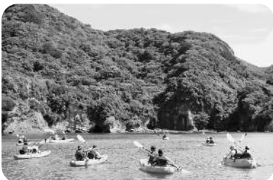
交流自治体である杉並区の小学生と、町の小学生が交流する漁村交流事業の様子です