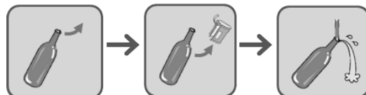
①キャップを外す ②ラベルを剥がす ③中を水洗いする