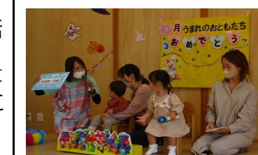
おたんじょうびおめでとう