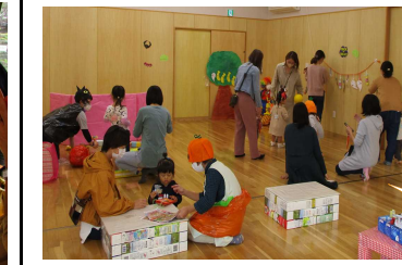
ハロウィンゲーム☆