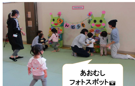
あおむし フォトスポット