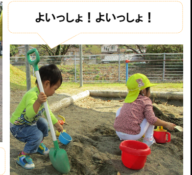
よいっしょ!よいっしょ!