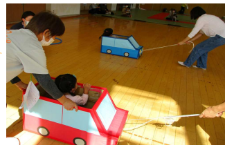
おかあさんと バランス!