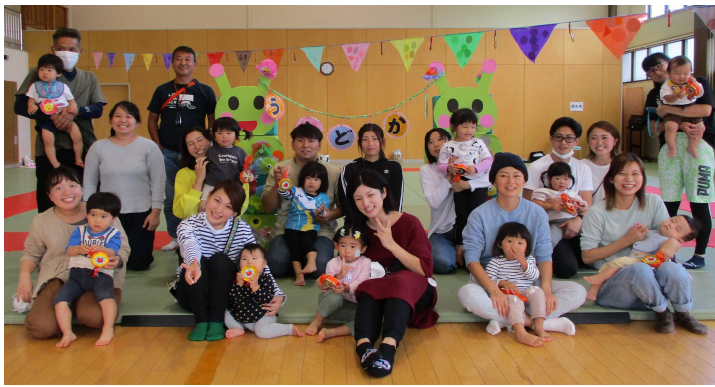
全員集合~ ニコリ笑って !(^^)!