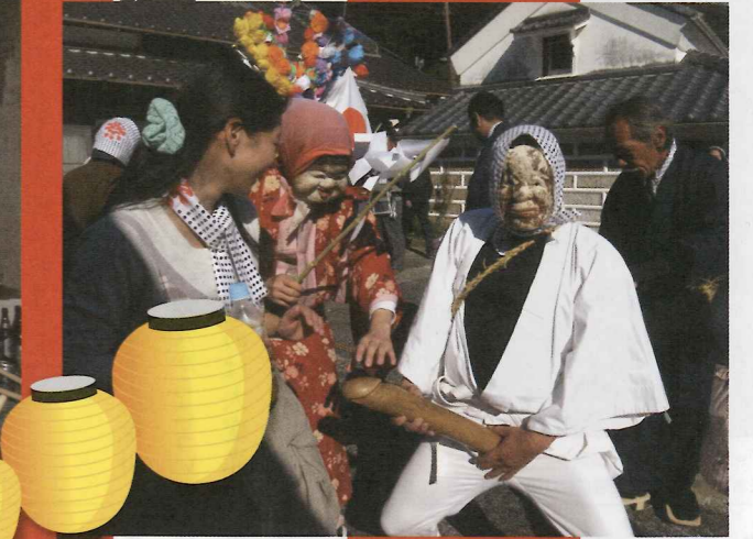
▼なんと言っても市之瀬のお祭りの特徴はひよっこ、おかめ、天狗が登場すること。宵祭りでは子孫繁栄を願い、お宮の舞台上で舞を奉納しました。天狗が竹竿を持ち、ひよっこがすりごぎを持って子どもや若い女性を追いかけ回したりしますが、それも縁起物だそうです。