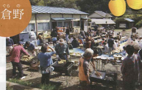
▲毛倉野は公会堂前広場に豚肉や焼きそばのBBQ。突きたての餅や綿菓子なども振る舞われました。天気にも恵まれ子どもからお年寄りまで毛倉野住民が集結。