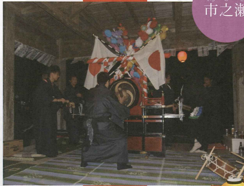
▲市之瀬の宵祭りは高根神社の舞台上太鼓台を据え置き行ないます。南伊豆で伝統的な着流しの祭装束に身を包み、ゆったりとした調子の太鼓が鳴り響いていました。区民による出店も充実していて、多くの人が詰めかけていました。