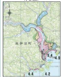
東海地震被害想定推定津波浸水域図(宇石地区)